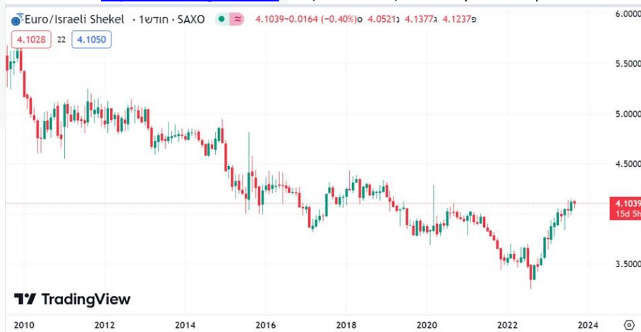
גרף שער השקל מול היורו, 2010-2023, אתר https://il.tradingview.com

מגמת ההתחזקות של השקל מול היורו פגעה קשות בתמורה נטו למגדל המייצא תוצרת טרייה לאירופה. לדוגמה: ייסוף השקל ב-5% מתרגם להפחתת הכנסה נטו למגדל פלפל אורגני לייצוא של כ-3600 לדונם, לפי מחירי המכירה של עונת 2022-23 הפחתת הכנסה נטו זו היא ההבדל בשורה התחתונה בין הפסד לרווח.