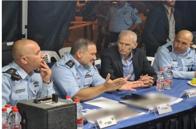
משטרת לואי דה - פינס *דוברות המשטרה: