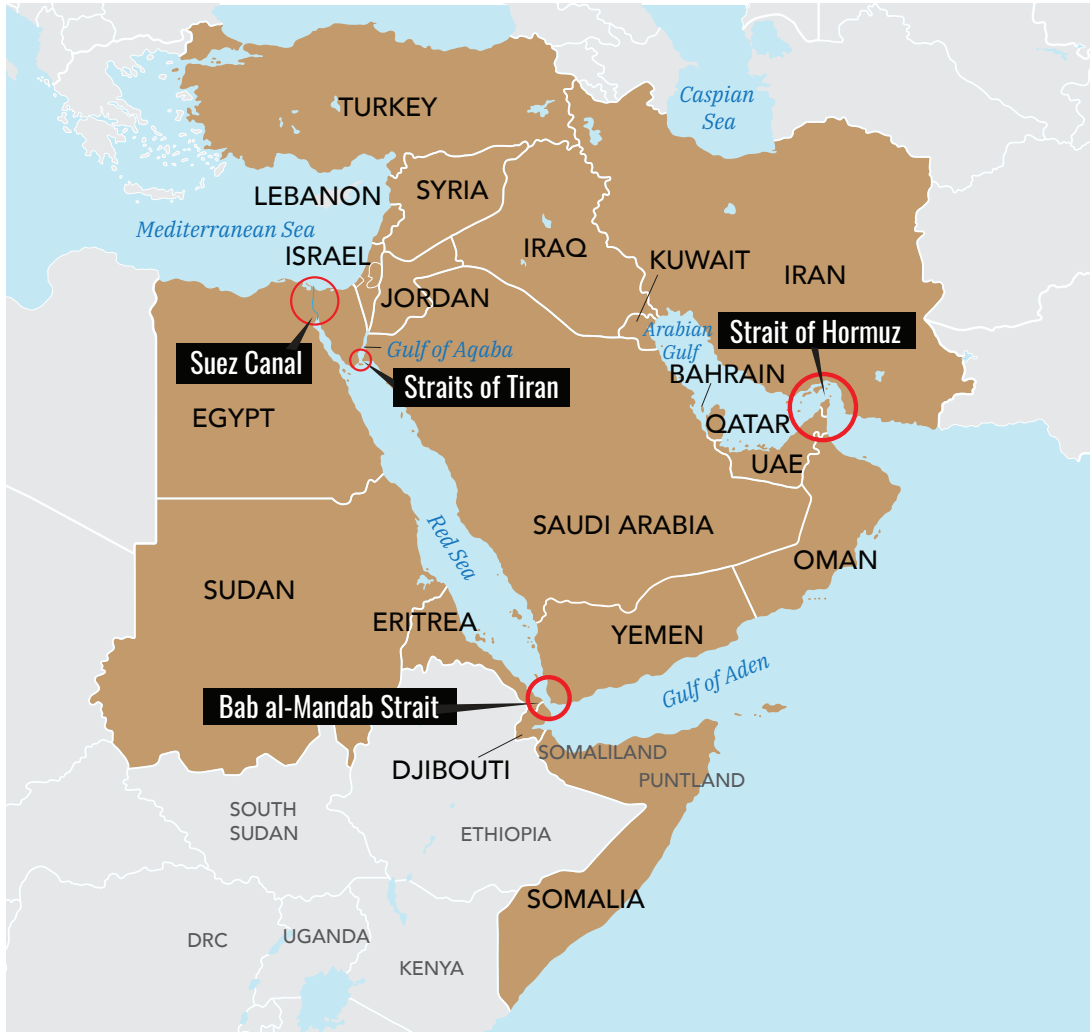
Figure 5. Bab al-Mandab Strait and Arabian Gulf

ה. באפגניסטן ובפקיסטאן ישנה אוכלוסייה שיעית חשובה אשר חלקה מהווה פוטנציאל השפעה, ומקור לגיוס מתנדבים-לוחמים ל"צבא האזורי". כתוצאה מהלחימה המתמשכת באפגניסטאן, מיליוני אפגאניים-שיעים המהווים קבוצת מיעוט בארצם ברחו למחנות פליטים באיראן. פליטים אלה היו מקור זמין לגיוס צעירים למשה"מ, ולבניית מיליציות לוחמות (2) שהבולטת שביניהן מכונה בשם 'פאטמיון' (Fatemiyoun Division). דיביזיית ה'פאטמיון' האפגאנית המונה על פי ההערכות כ-10000 פעילים (3) ודיביזיית ה'זינביון' (Zaynabiyoun) הפקיסטאנית, אף נוידו ללחימה בסוריה והשתתפו בקרבות מרכזיים להגנה על המשטר נגד המורדים ונגד ארגון "המדינה האסלאמית". שתי הדיביזיות מהוות כוחות ניידים קלים וחלק מ"הצבא האזורי". מרכיבים מהדיביזיות האפגאנית הפקיסטאנית חונות בבסיסים איראניים בסוריה קרוב לגבול עיראק, וחלקם נשלחו למחנות באיראן ומהווים כוח התערבות אזורי זמין.