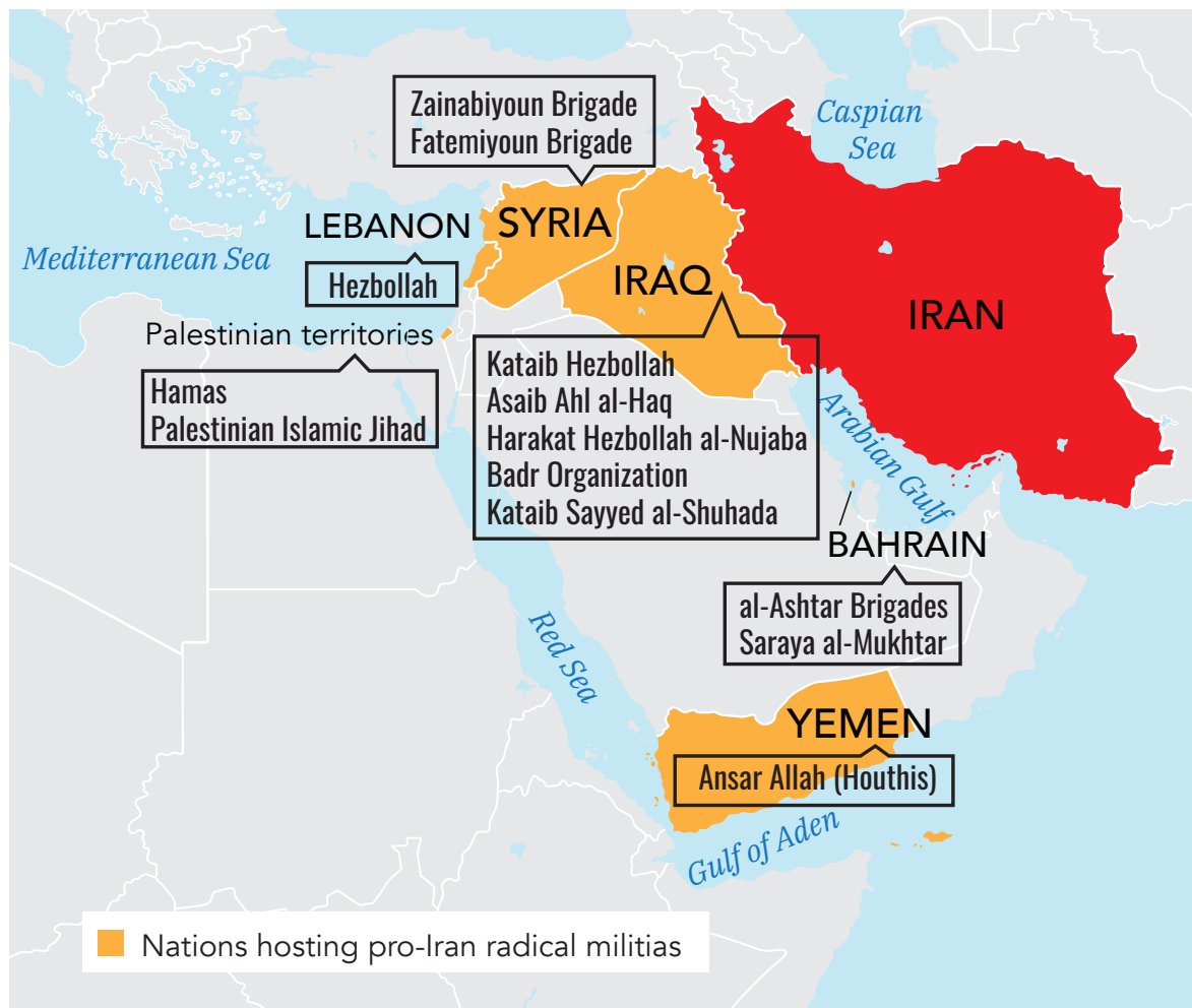
Figure 1. Iran and Its Proxies

באמצעות אסטרטגיה זו הפכה איראן לכוח דומיננטי, מרתיע, מעצב ומשפיע על משטרים במדינות שהבולטות שבהן הינן סוריה, עיראק, לבנון ותימן שם השכיחה איראן לנצל את המלחמות והסכסוכים הפנימיים על מנת להעמיק את השפעתה הפוליטית, כלכלית וצבאית.