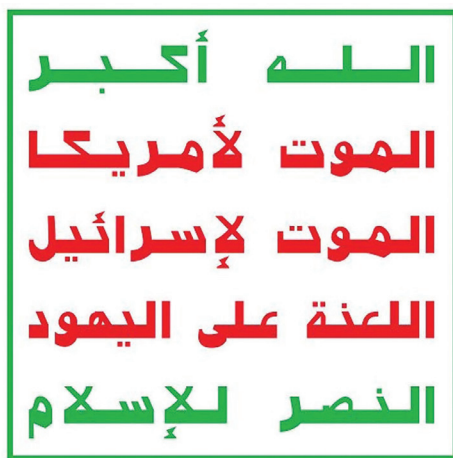
Figure 4. Houthi Slogan

In translation, the Houthi slogan reads, "Allah/God is greatest, death to America, death to Israel, curse the Jews, victory to Islam."